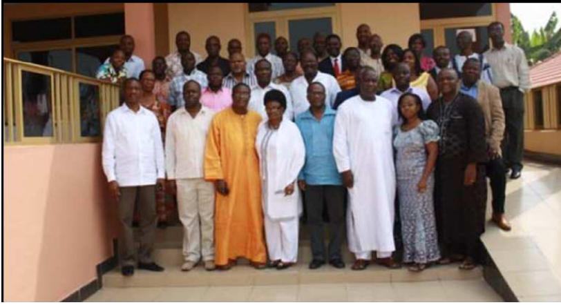
Les participants de la réunion de sensibilisation pour les législateurs ghanéens. Ci-dessous, une partie des acteurs lors de la réunion au Nigéria.